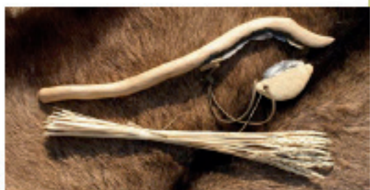
Fouaille, croûtes et brins d'épeautre