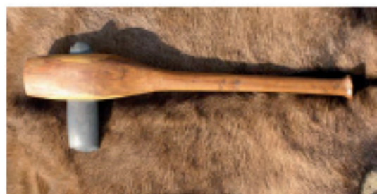
Hache servant pour le défrichage